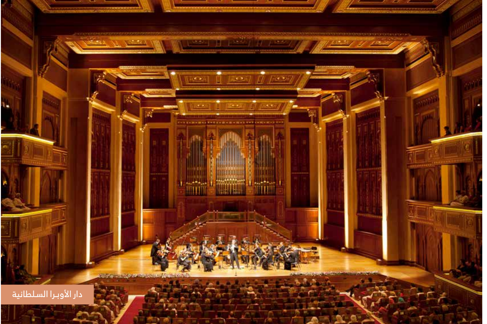
دار الأوبرا السلطانية