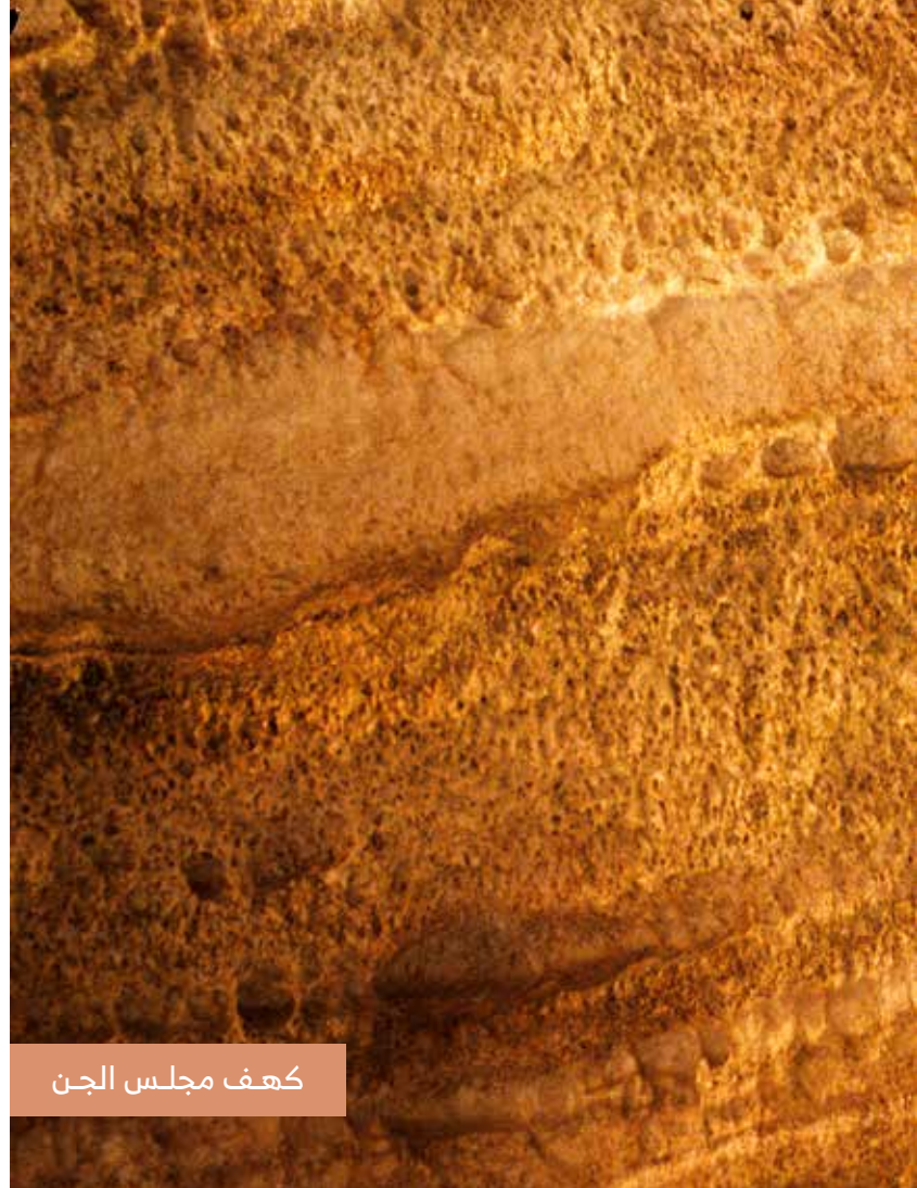
كهف مجلس الجن

تتميز ولاية قريات أيضاً بشواطئها الجميلة مثل الشاطئ الأبيض ؛ ذلك الخليج البديع بالقرب من جنوب قرية "فنس"، على الطريق الساحلي بين ولاية صور وولاية قريات. يشتهر هذا الشاطئ برماله البيضاء التي شكّلت إثر الشعاب المرجانية في العصور القديمة، ويعتبر مكاناً مرتفعاً ومناسباً للتنزه والتخييم قرب مياه البحر.