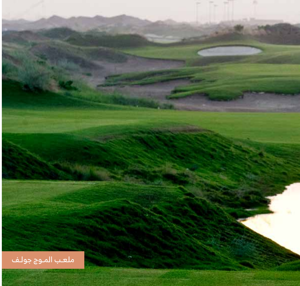
ملعب الموج جولف

انطلق إلى الموج مسقط ؛ المشروع المثالي الشامل، والذي يتضمن ممشى، ومنتزه، ومحلات تجارية، والعديد من المطاعم، والمقاهي العالمية والمحلية، والبوتيكات المتخصصة، وأماكن الإقامة الفاخرة وملعب للجولف. هنا بمقدورك استئجار القوارب، واليخوت للمناسبات المختلفة، والانطلاق في رحلات بحرية إلى الجزر القريبة.