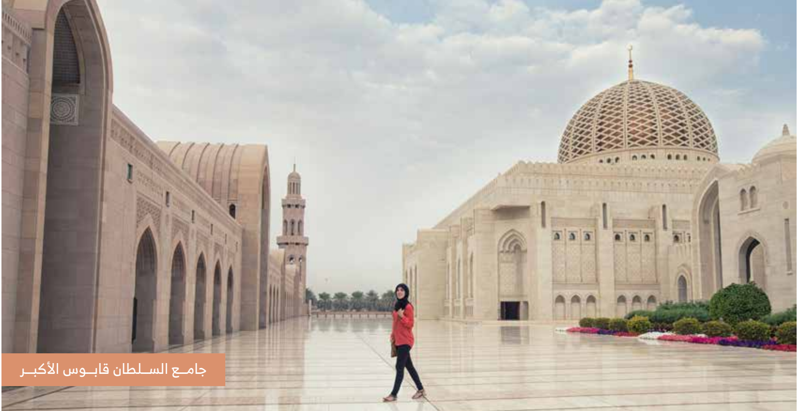
جامع السلطان قابوس الأكبر

حضيت ولاية بوشهر بتخطيط عمراني حديث، مما جعلها تزخر بالعديد من المعالم الحضارية والمنجزات العصرية، فضمت الكثير من المؤسسات والجهات الحكومية وسفارات الدول الشقيقة والصديقة، بالإضافة لمدينة الإعلام وأضخم المراكز التجارية التي أسهمت في