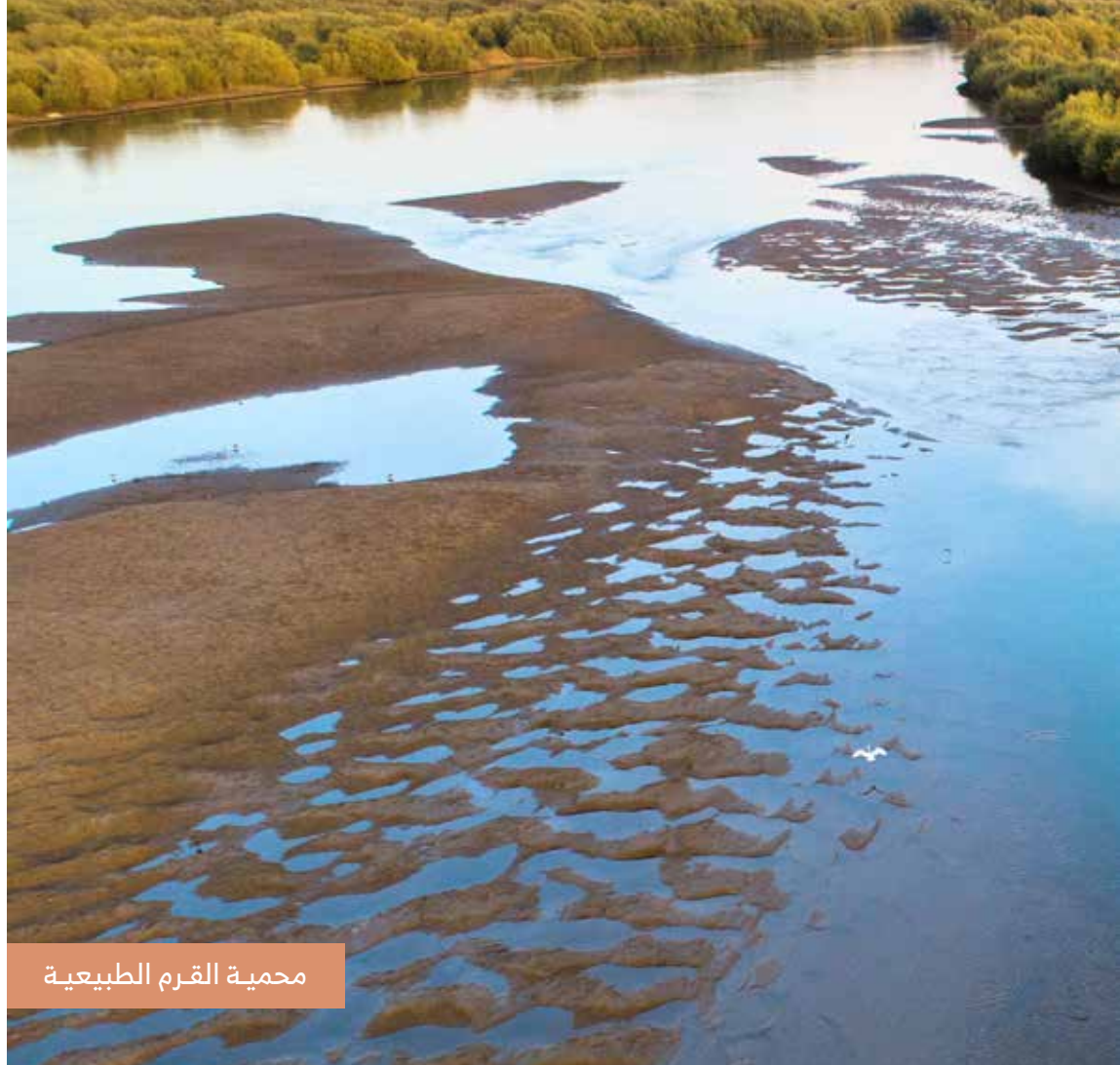
محمية القرم الطبيعية

ستجد في قلبها مسطحات خضراء جميلة، وتتفياً تحت ظلال أشجار معمرة كشجرة "الغاف". تعد الحديقة مكاناً مثالياً لممارسة رياضة المشي لمسافات طويلة، والاستمتاع بمرافق الترفيه التي تضم مساحة متكاملة للألعاب الكهربائية، وبحيرة صغيرة يمكن فيها ركوب قوارب العجلات اليدوية، ومسرح (المدينة) الضخم الذي تقام فيه عروض حية ومباشرة، كالحفلات الموسيقية والمسرحيات ومسابقات الأطفال.